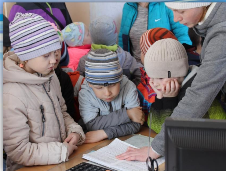
Игра-путешествие «В поисках истины»