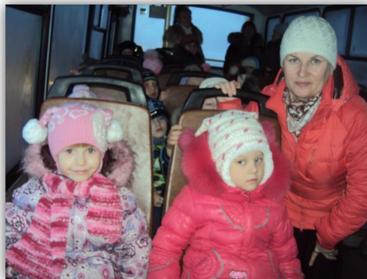
Экскурсии на предприятия и в учреждения города