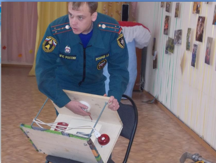
Встреча с интересным человеком