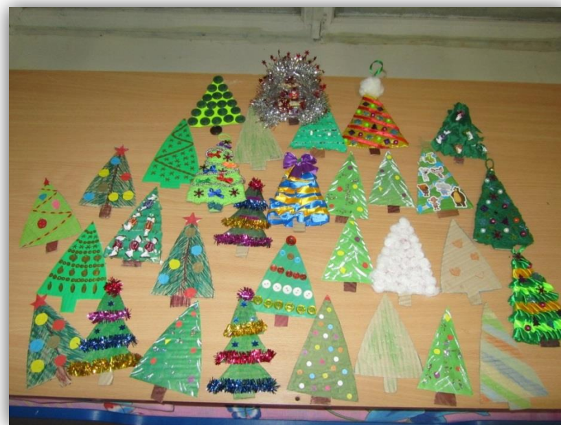
Мастер-класс «Гофрированные ёлочки»