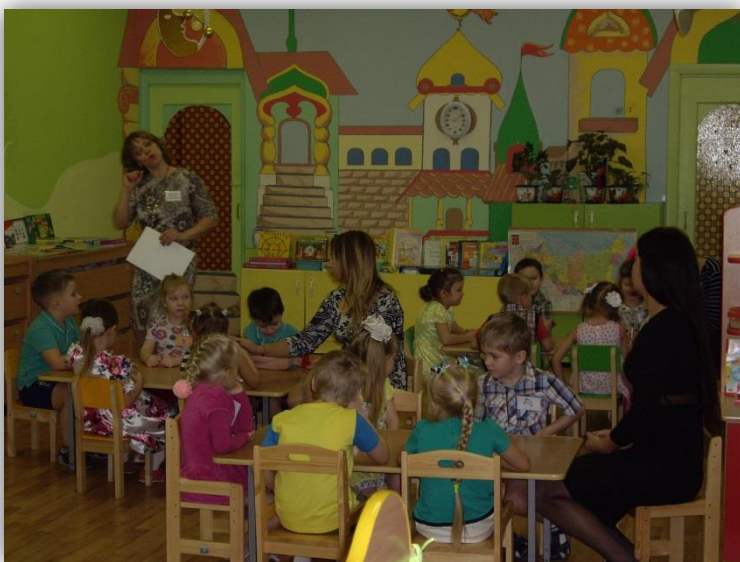
Викторина «Город труда»