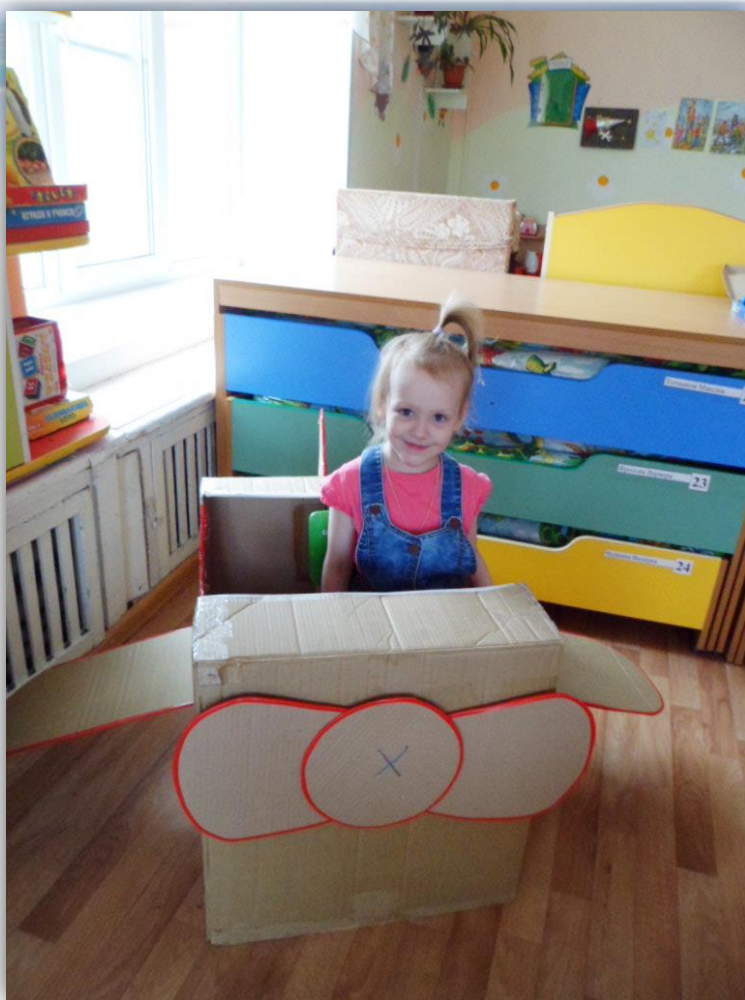
Конкурс на лучшую поделку из гофрокартона