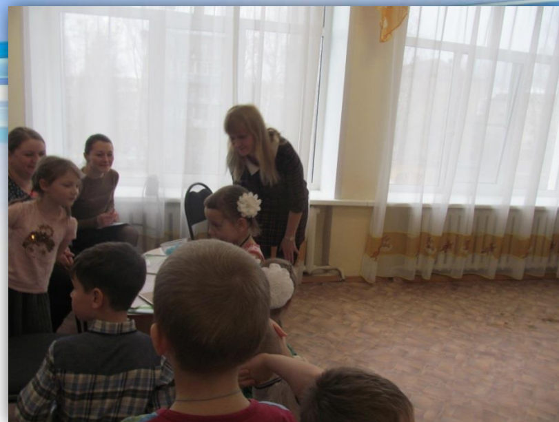
Круглый стол «Что такое ДВП?»